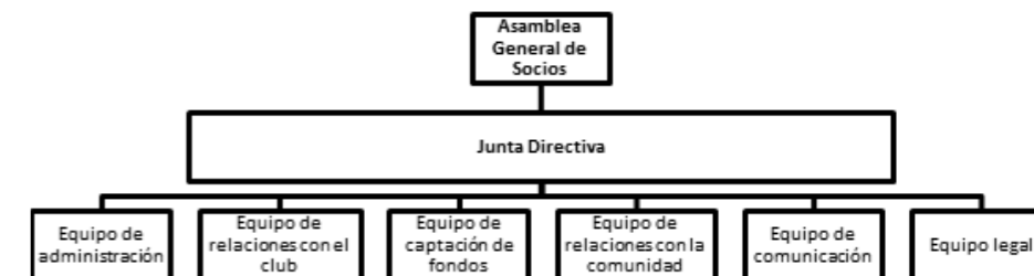
Figura 2. Organigrama tipo de una asociación de aficionados

las cuentas o resolver sobre la admisión de nuevos socios. Además el presidente representa a la asociación frente a terceros o la administración (firma los contratos etc.), el secretario lleva la gestión administrativa, los libros, expide certificados y el tesorero recauda y custodia los fondos de la asociación y ordena los pagos en nombre de esta. Aparte de estos puestos puede haber vicepresidente(s) que sustituye al presidente en su ausencia y vocales que pueden o no estar a cargo de alguna área.